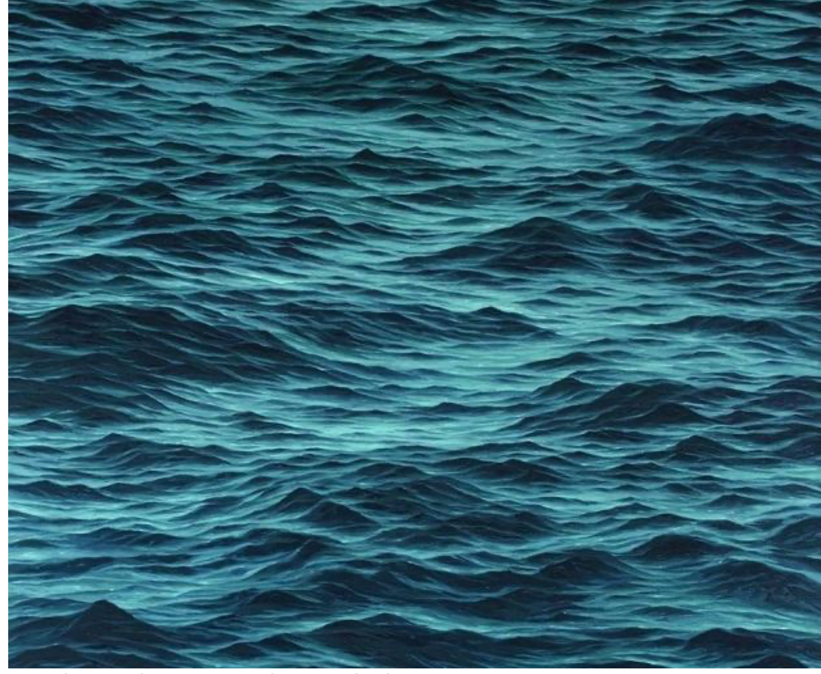
La madre naturaleza protagoniza la pintura de Aikman.