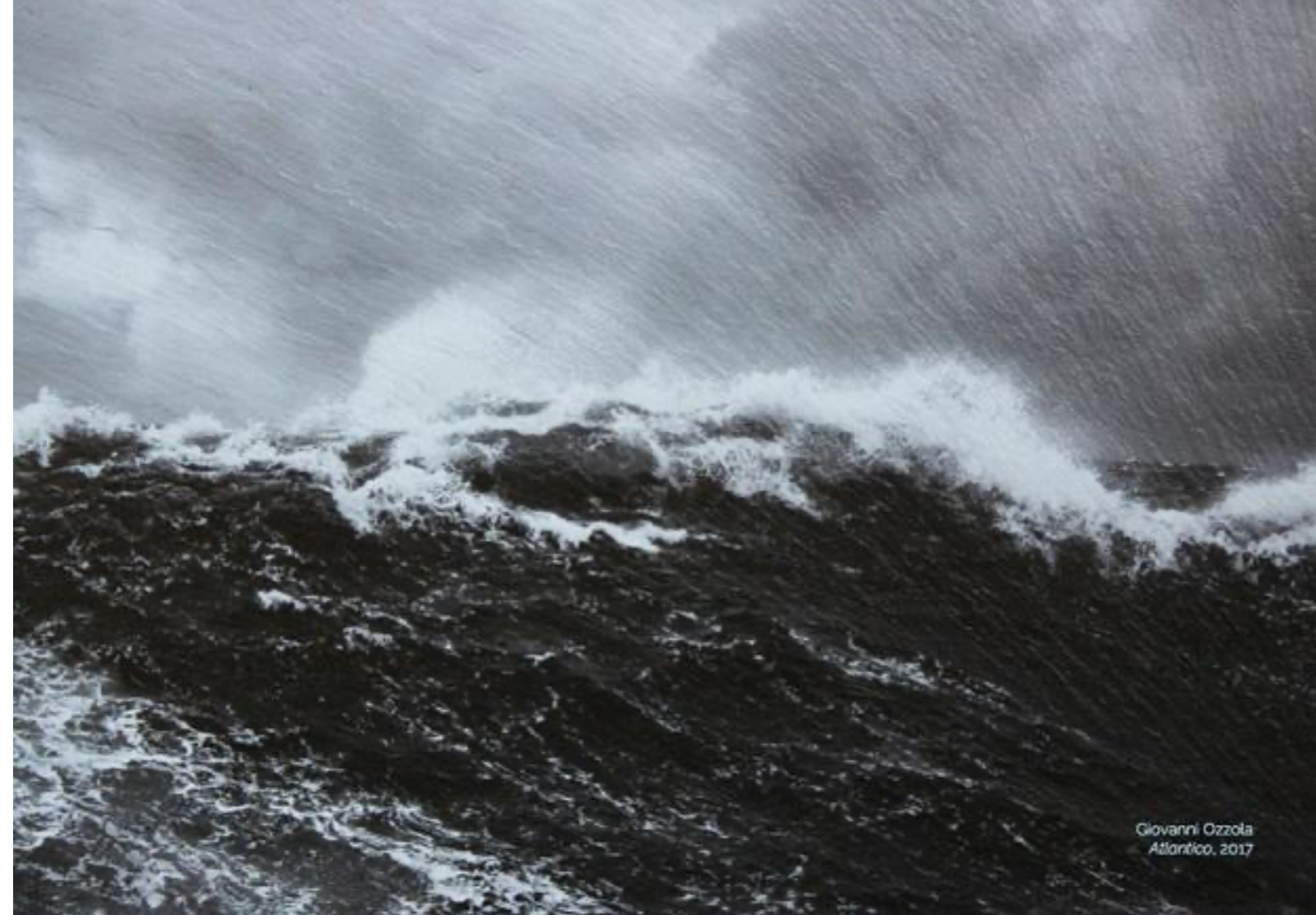
Una de las obras que se pueden ver en 'Mirage', titulada 'Atlántico'. GIOVANNI OZZOLA

El centro cultural Suburbia inaugura este sábado a las 20.00 horas la exposición 'Mirage', de Giovanni Ozzola (Florencia, 1982), que actualmente vive y trabaja en las Islas Canarias.