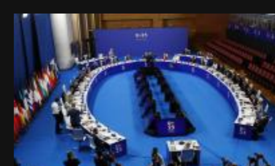
La reunión de jefes de Estado y de Gobierno de la UE, en imágenes