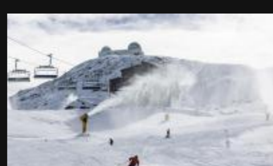
La Sierra ya recibe esquiadores