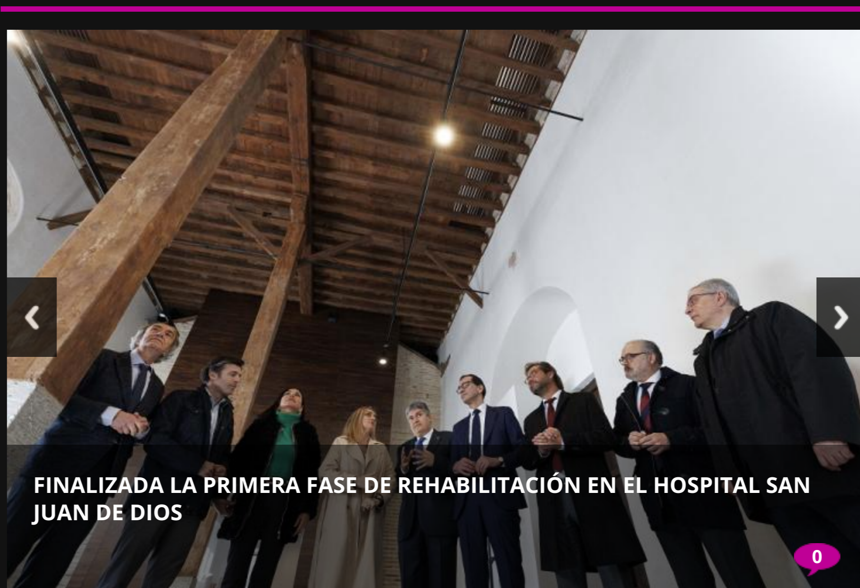
FINALIZADA LA PRIMERA FASE DE REHABILITACIÓN EN EL HOSPITAL SAN JUAN DE DIOS