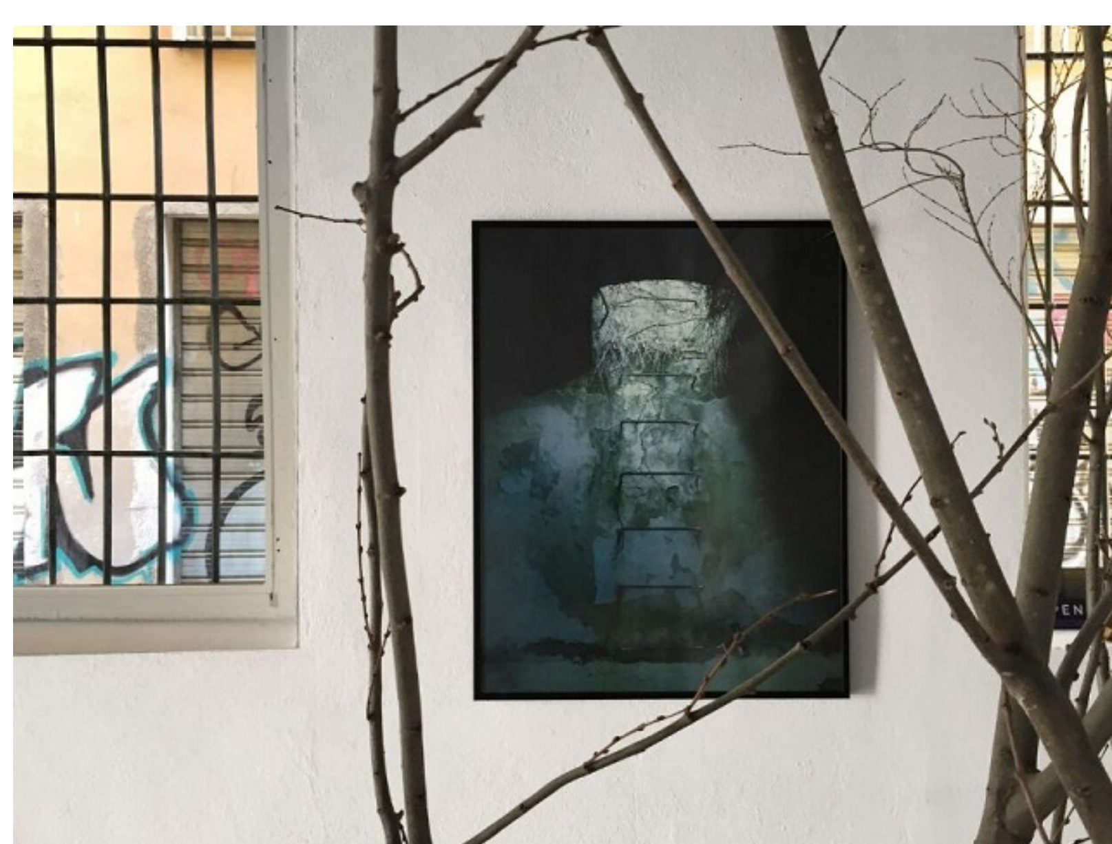
Una de las fotografías de la serie 'Alla conquista dell'inutile'.