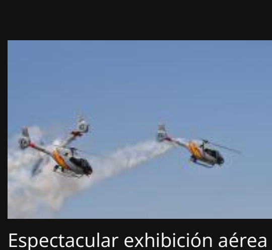
Espectacular exhibición aérea en Armilla por el 20º aniversario de la Patrulla Aspa