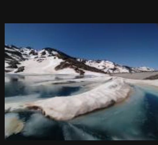
El deshielo de Sierra Nevada como nunca lo has visto