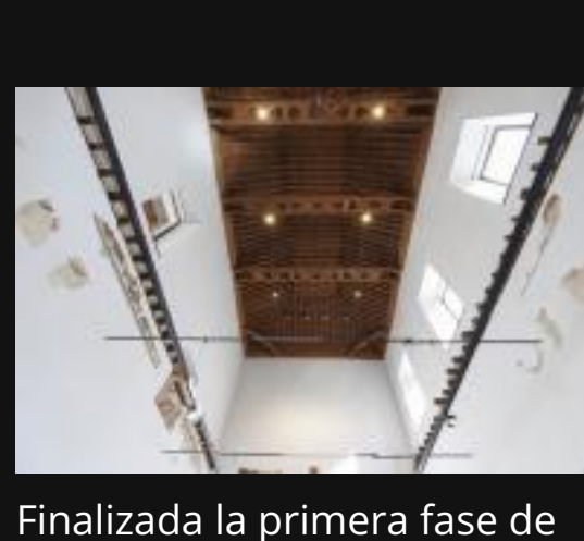
Finalizada la primera fase de rehabilitación en el Hospital San Juan de Dios