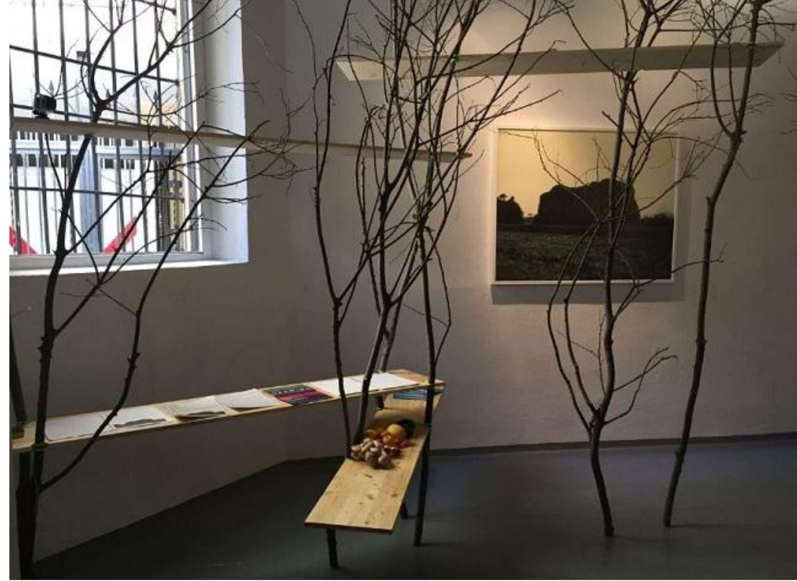
Instalación de Robert Pettena.